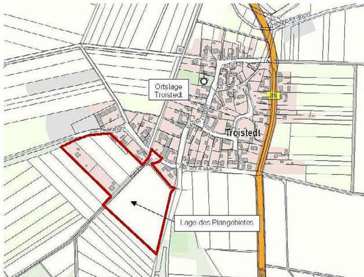
Geoproxy Thüringen (Zugriff: 2022-04) Übersichtsplan – Geltungsbereich des Bebauungsplanes (unmaßstäbliche Darstellung)

Für den räumlichen Geltungsbereich der Aufhebung des Bebauungsplans ist nachfolgender Lageplan maßgebend. Er ergibt sich aus folgendem Kartenausschnitt: