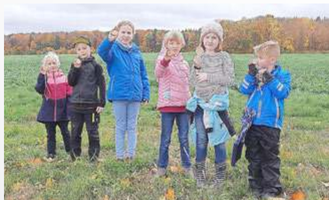
Fleißige Helfer mit Waldrettermedaille ausgezeichnet