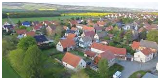
Ulla von oben