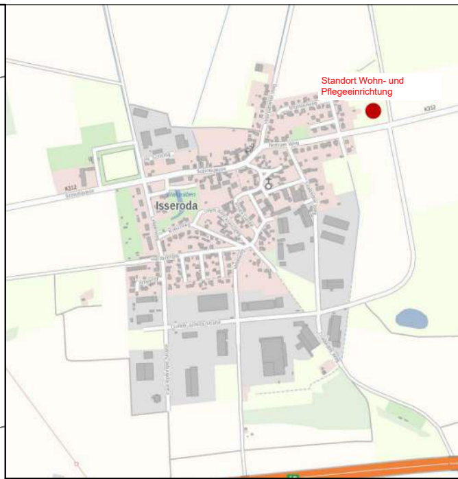
Lage im Gemeindegebiet (Übersichtskarte ohne Maßstab)