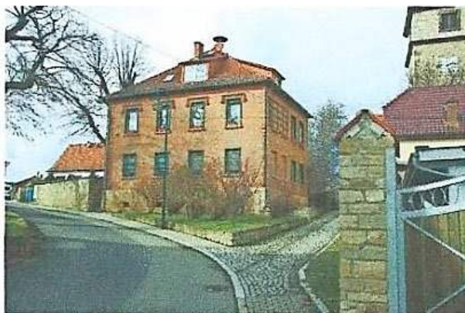
Die alte Schule

Eine Verbesserung der dörflichen Lebensbedingungen brachte der Bau der Wasserleitung im Jahre 1905, die eine der ersten in der Umgebung war.