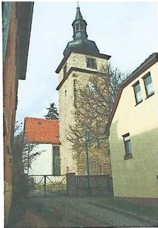
Die Kirche "St. Johannes Baptista"

Die Gemeinde besaß über Jahrhunderte ein Backhaus, ein Brauhaus, ein Gemeindegasthaus und eine Schule. Die Lehrer sind seit 1586 namentlich nachgewiesen. In der sogenannten „Fortbildungsschule“ wurden alle Altersstufen in einer Klasse unterrichtet. 1956 wurde der Schulbetrieb eingestellt und die Schüler gingen in die neue Zentralschule nach Isseroda.