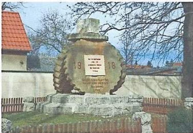
Das Kriegerdenkmal zum Gedenken der Gefallenen im I. Weltkrieg

Utzberg war früher ein reines Bauerndorf und der Ackerbau war der Haupterwerbszweig der Landwirtschaft. Besonders hervorzuheben ist der Anbau von Waid . 1579 bauten die Utzberger Bauern auf einem Drittel der Ackerfläche die Färberpflanze an.