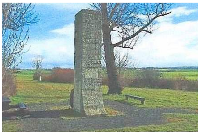
Der Napoleonstein an der B7

Die Kirche wurde im 15. Jahrhundert errichtet und diente einige Zeit als Wehrkirche zum Schutz der Bürger. Durch den Krieg stark beschädigt, wurde sie in der zweiten Hälfte des 17. Jahrhunderts wieder aufgebaut. Im Innenraum beeindruckt der aus reichem Schnitzwerk bestehende und sehr farbenfrohe Kanzelaltar. Er wurde 1725 von dem Erfurter Künstler Valentin Dittmar geschaffen. Auffallend ist der an der Südseite der Kirche stehende Turm. Seine heutige Form erhielt er 1875.