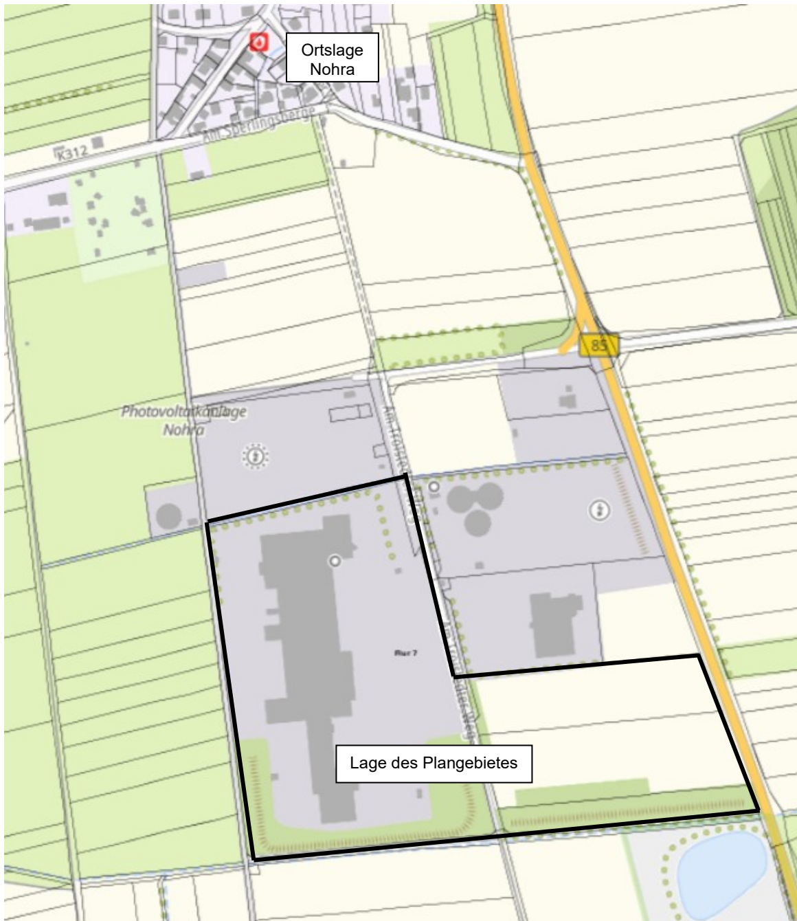
Thüringen Viewer (Zugriff: 2023-08) Übersichtsplan – Geltungsbereich des Bebauungsplanes (unmaßstäbliche Darstellung)